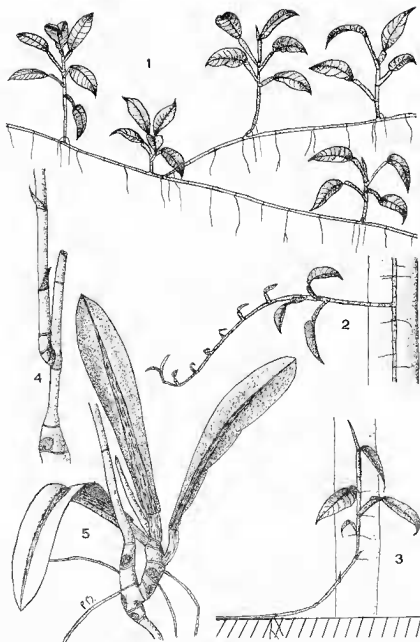
Pl. 3. — Philodendron guttiferum Kunth : 1, flagelle se développant au sol; des racines adventives apparaissent aux nœuds correspondant à l'insertion de cataphylles; deux types de ramification interviennent : d'une part formation de nouveaux flagelles et d'autre part émission de tiges dressées portant des feuilles assimilatrices; 2, flagelle apparaissant à l'extrémité d'une tige latérale, dans une zone éclairée : les pièces foliaires présentent un limbe réduit; 3, réversion d'un flagelle vers le stade à feuilles assimilatrices, au contact d'un tronc. — Philodendron linnæi Kunth : 4, réitération traumatique au niveau d'un flagelle : à la suite d'une destruction de l'apex, un nouveau flagelle est apparu; 5, réitération spontanée au niveau d'une rosette sympodiale défeuillée : une nouvelle rosette sympodiale apparaît sans passer par le stade flagelle (1-3 \times 1/10; 4 et 5 \times 1/3).